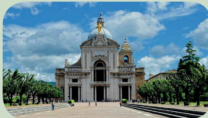
La Basilica di San Francesco

Per informazioni Segreteria Organizzativa COMUNITÀ DEL DIACONATO IN ITALIA